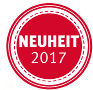
Pressdrive AM 2E

Körper aus Polypropylen, innere Membran aus Naturkautschuk und Schrauben, Unterlegscheiben, Muttern, aus Edelstahl AISI 304.